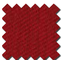
Rouge Empire 0087