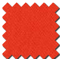
Rouge HV 0432