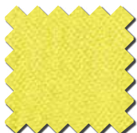
Jaune HV 0415