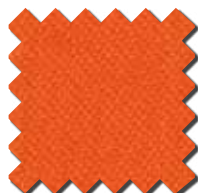
Orange HV 0430